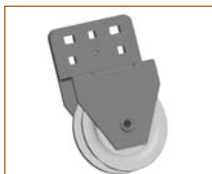
Systém ručního zdvihu HKU1